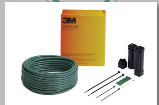
Kit de accesorios