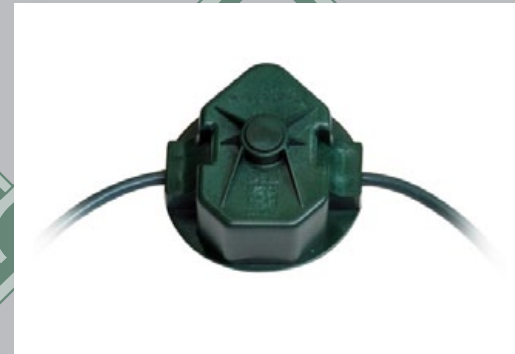
Sensor SERIR 50