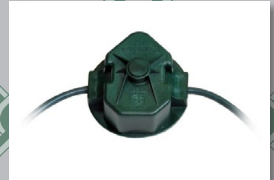
Sensor SERIR 50