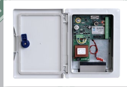
Unidad de análisis