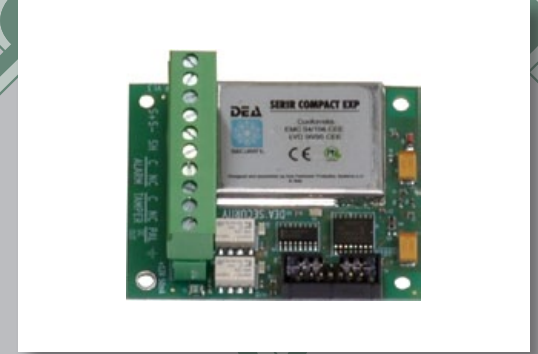
Placa electrónica de expansión