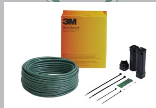
Kit de accesorios